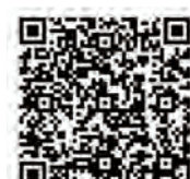
▲ 空き家情報バンクホームページ