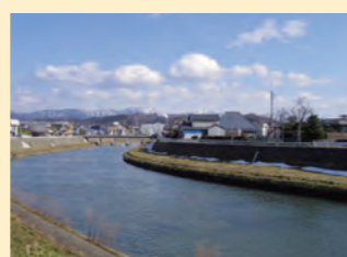
▲ 水運を支えた竹田川を挟んで金津奉行所跡と市姫橋を望む

この土地で生まれ育った人には、当たり前すぎて逆に見えないような歴史的な豊かさや貴重さを、展示や講演などを通じて発信していきたいと考えています。