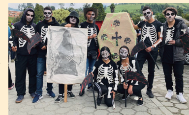
▲ 仮装大会での生徒たち

さて、最近、元同僚からメッセージを受け取り、私と一緒に数学を教えた生徒からの声が入っていました。「自分が人生の中で理解できた唯一の授業で、楽しかった」これを聞いて、元同僚は本当に喜んでいました。職業訓練校の生徒は、小中学校を卒業してから入学しますが、数学が身につけている生徒はほとんどいません。学校では教科書を使わないのが普通で、正確な定義や知識を学べないまま進学してくるのです。一応、訓練校ではじめから復習します。そこで教科書がないため、将来の教科書として使えるように正確な知識と好奇心を刺激する問題を取り入れた授業の組み立てを実践したところ、同僚の教員も興味を持ってくれました。経験のある教員はプライドが高い人が多いのですが、素直に学ぶ姿勢を持つ人と出会えて私も幸せでした。それでは、今年一年がよい年になりますように。