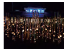
▲昨年のあわら灯源郷

なお、例年募集しております着火ボランテア「チャッ火ちゃん」と「模擬店」については、新型コロナウイルス感染防止の観点から募集や設置は行いません。