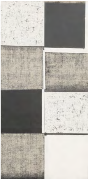
◀ Drawing by drawing ▶ 1979年 紙・鉛筆(削り) 480.0×142.0cm 2020年 キャンバス・油彩(削り) 199.0×97.0cm

会場 / 金津創作の森美術館 アートコア 時間 / 10:00 ~ 17:00 (最終入場 16:30) 観覧料 / 一般 600円、65歳以上・障害者 300円 障害者の介護者 (当該障害者1人につき1人)・高校生以下無料