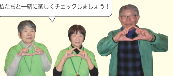
▲フレイルサポーターの皆さん