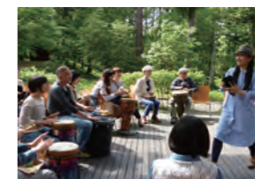
昨年のワークショップの様子

楽しいドラムサークル(ワークショップ) 世界の打楽器を使ってサウンドを楽しもう! 12日(日)14:00～15:30 会場/アートコア ミュージアム-2 テラス