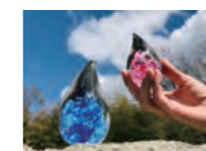
キラキラガラスしずく玉づくり