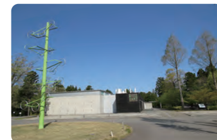
今からメイン会場となるアートコアロータリー周辺(上) アートコア進入路(下)