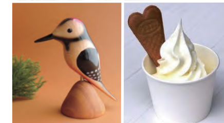
出店者のクラフト作品・食(ソフトクリーム)

企画展「ちはやふるの世界」開催中のため「ちはやふる」ファンとの相乗りにご協力ください。