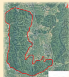
▲横山古墳群航空図 赤い範囲に約300基もの古墳があります

とき 2月17日(日) 13時30分~ ところ 金津本陣 IKOSSA 3階 研修室1 演題 継体天皇とあわら 講師 堀 大介氏 (越前町織田文化歴史館学芸員) 費用 無料 定員 30人 (事前申し込み不要)