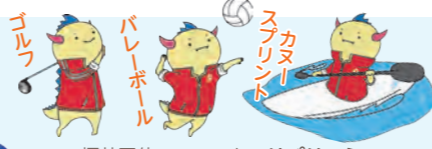
福井国体マスコット はぴりゅう