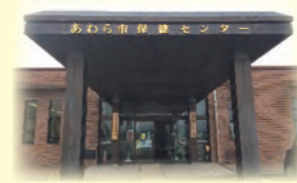
保健センターの中にどうぞ