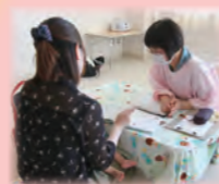
おっぱい相談の様子

▼保育士さんの子育て相談 訪問エリア あわら市内 対象 子育て中の人 内容 上の子の赤ちゃん返りやしつけなど、子育ての悩みをゆっくりお聞きします。 費用 無料