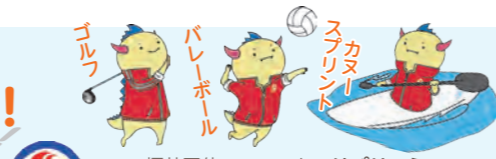
福井国体マスコット はぴりゅう