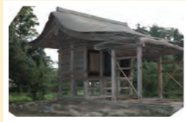
▲修復前の本荘春日神社本殿

郷土歴史資料館 (金津本陣 IKOSSA 2階) 休館日 月曜日・第四木曜日 (祝日の場合はその翌日) 開館時間 9時30分～18時 (最終入館 17時30分) 問合せ ☎ 73-5158