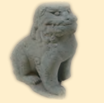
▲最古級の越前狛犬 (本荘春日神社蔵) 現在開催中の企画展で展示中