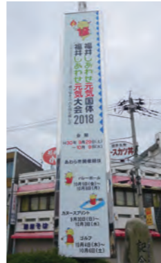
J R 芦原温泉駅前の広告塔