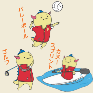
福井国体マスコットはぴりゅう

「しあわせ元気国体」。たしかに健康で元気であることがしあわせの素だと思えます。みんなで元気に福井国体を盛り上げましょう。