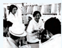
婦人会の湯茶接待おもてなし

玄関先に並べ、それが沿道で競うように咲き誇っていたことを今でも鮮明に思い出します。区長さんをはじめ、婦人会など関係者の皆さんが総力を挙げて花を育て、お世話をしてくれたおかげで、あのように見事な花を咲かせてくれたのだらうと思います。