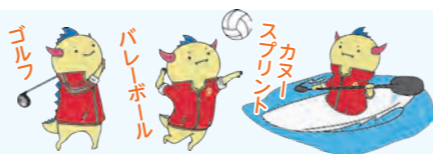
福井しあわせ元気国体マスコット はぴりゅう