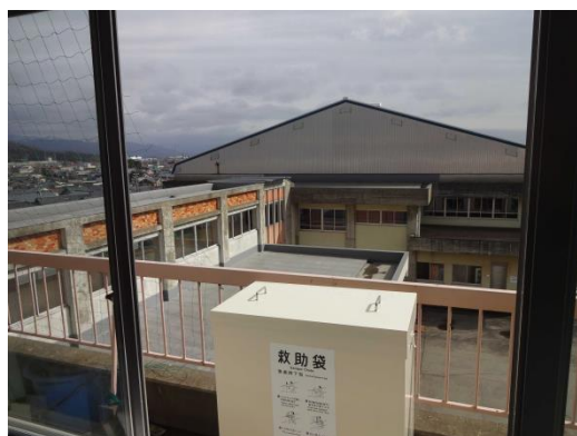
グリーンカーテン除去後

救助袋設置付近にグリーンカーテン用のネットがかぶっており速やかに取り出せない状況になっていたが、使用に影響がある部分は撤去した。また、ガス漏れ警報器を家庭科室に設置した。