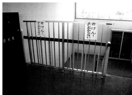
工事後 (120 c m)