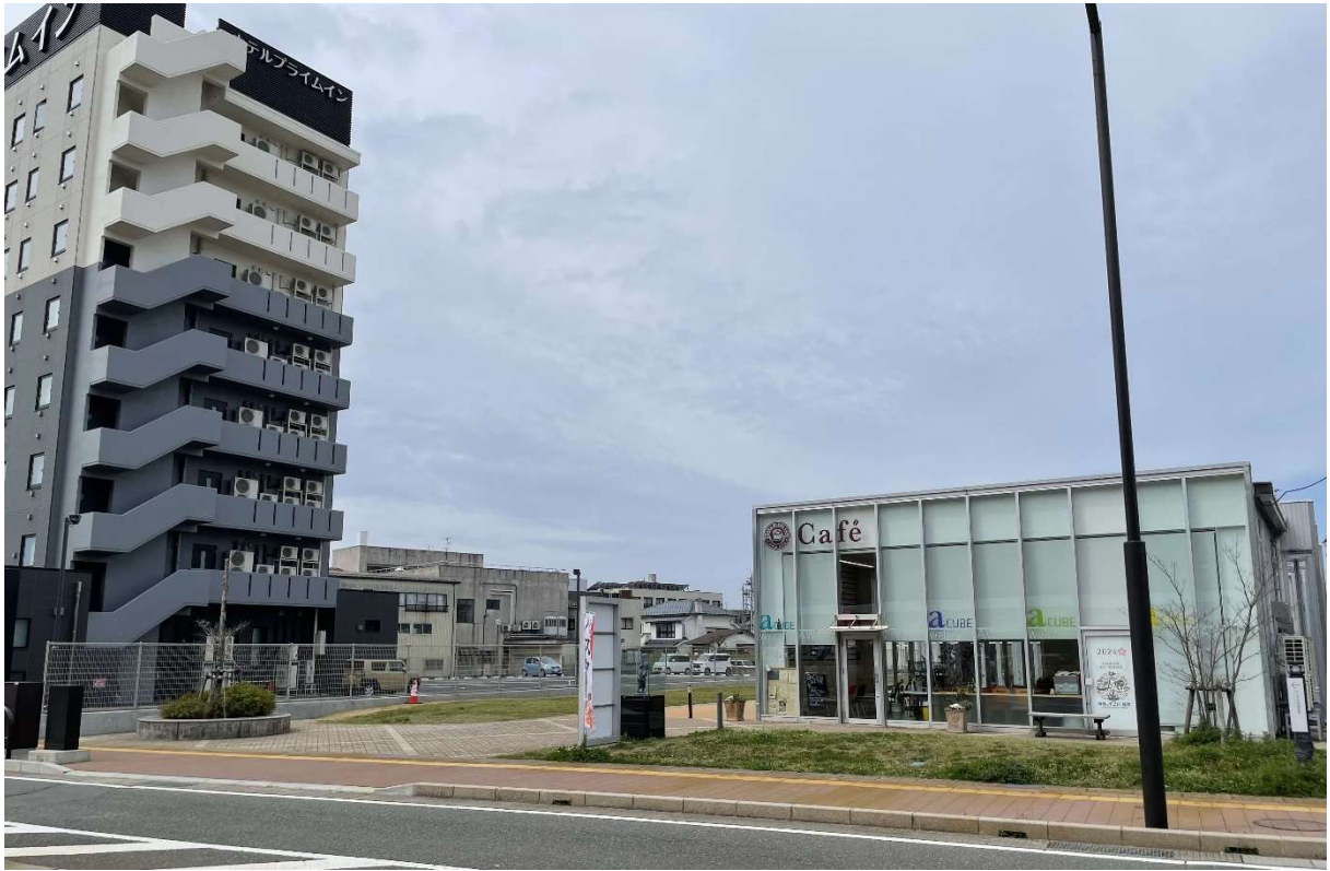
(芦原温泉駅側から)