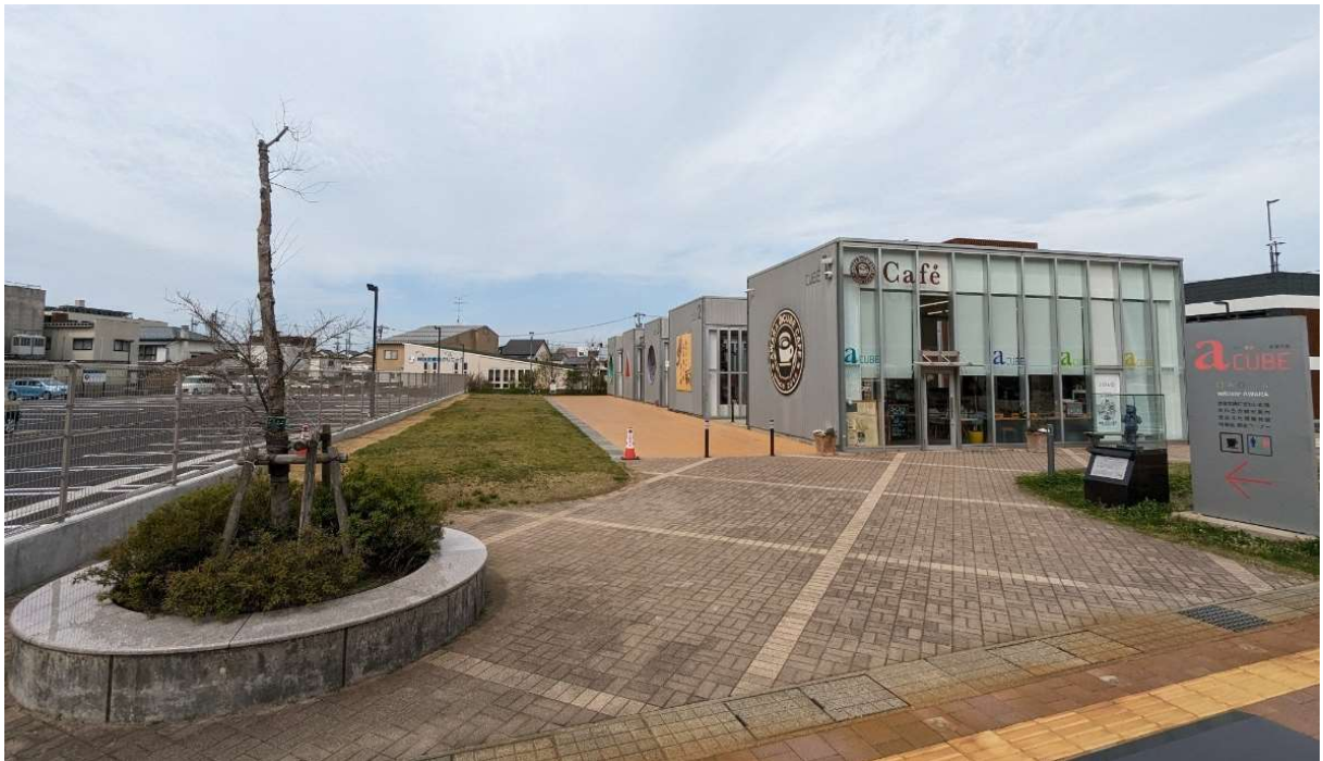
(芦原温泉駅側から)