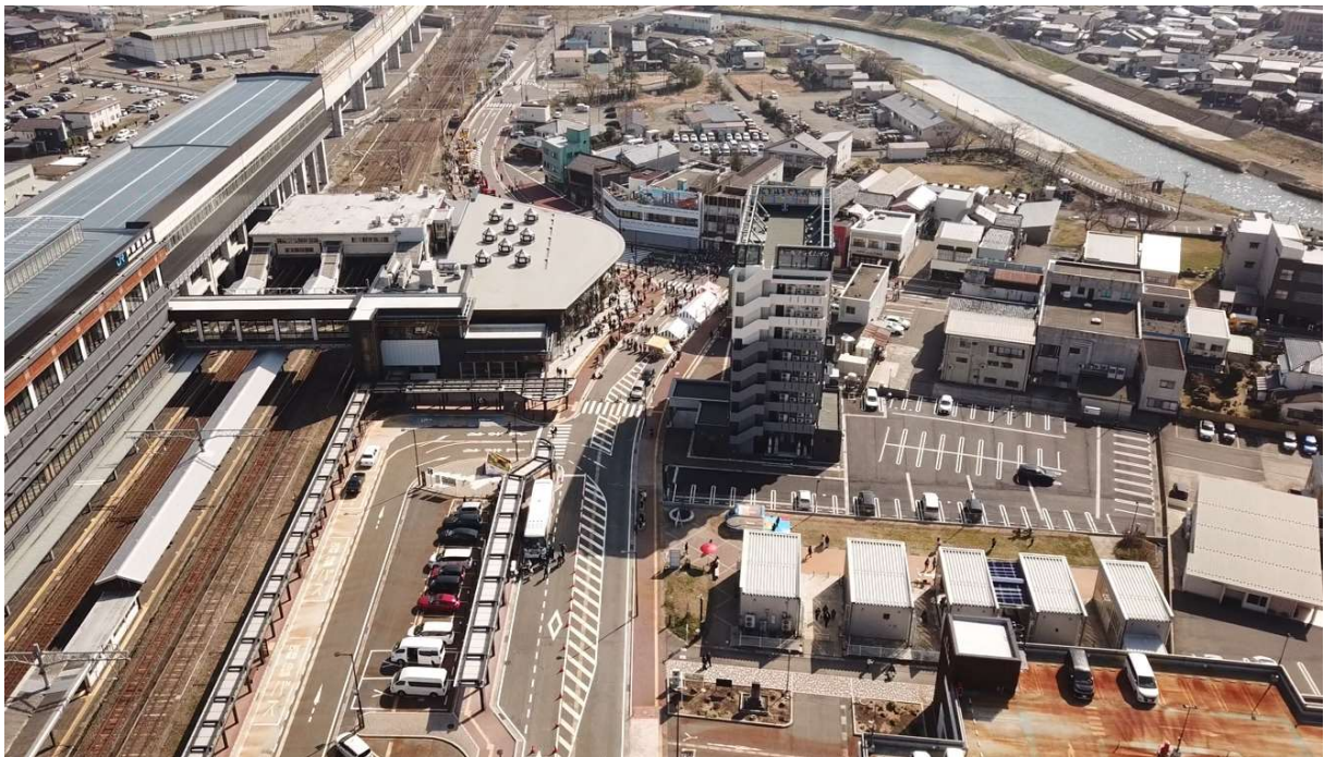
(芦原温泉駅周辺 手前が北。金津本陣にぎわい広場は右下辺り。)