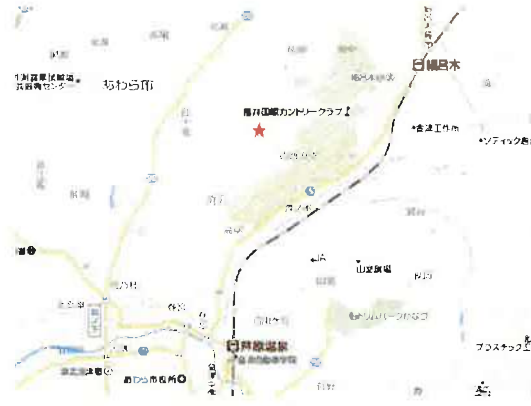
地図: 金津ICまで車で5分の距離です