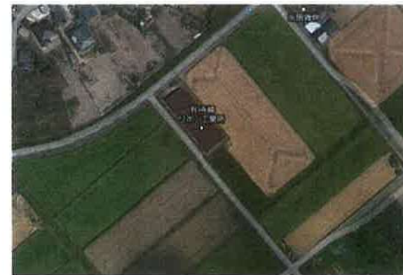
周辺の様子: 幹線道路沿いで、周りは田んぼです