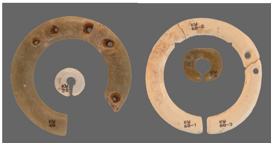
第 1 図 玦状耳飾の大きさ比較（左外：KW 48（最大）、左中：KW 20（最少・未展示）、右外：KW 68、右中：KW 58

大きさの面から、最も大きいものは上段左側に展示した 18 号土壙から出土した KW 48（整理番号、以下全て同様・第 1 図左外）で、一部を欠失しますが、長さ・幅共に 6.8 cm を測ります。その次に大きいものが上段右側に展示