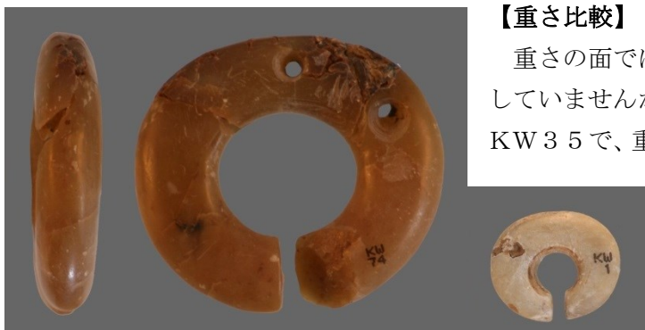
第2図 玦状耳飾の重さ比較（左：KW74、右：KW1）

中段左側に展示している26号土壙から出土したKW74（第2図左）で、二番目に重く、重量は55.9グラムを測ります。最も軽いものは、先に最も小さいものとして挙げ