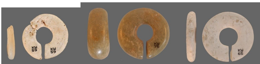
第3図 玦状耳飾の厚さ比較（左：KW59（最薄）、中：KW75（最厚）、右：KW65（最薄）

厚さの面では、最も分厚いものが下段中央に展示の26号土壙から出土したKW75（第3図中）で、厚さ1.5cmを測ります。反対に薄いものは下段左側に展示の20号土壙から出土したKW59（第3図左）、下段右側展示の24号土壙から出土したKW68（第3図右）で共に0.6cmです。厚さでは、大きさ、重さほどの開きはみられません。それでも2.5倍の差があります。特に大きさ自体はそれ程違いがないにもかかわらず、これほど厚さに差があるのは、単なる形態差が石材、時期等の違いによるものか残念なことに明らかではありません。