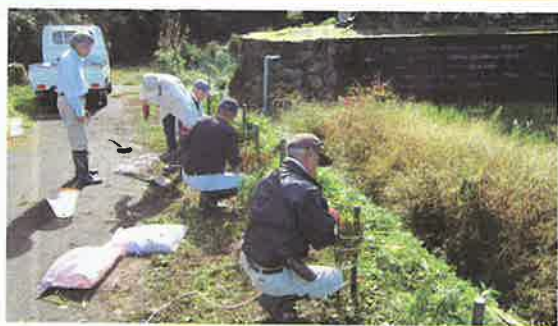
地域での植樹活動 (南越前町)