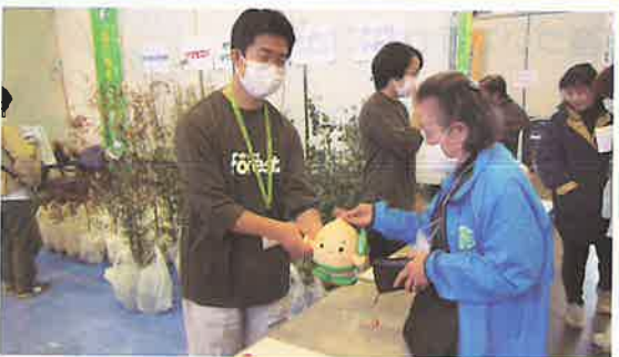
緑化苗木の配布 (敦賀市)