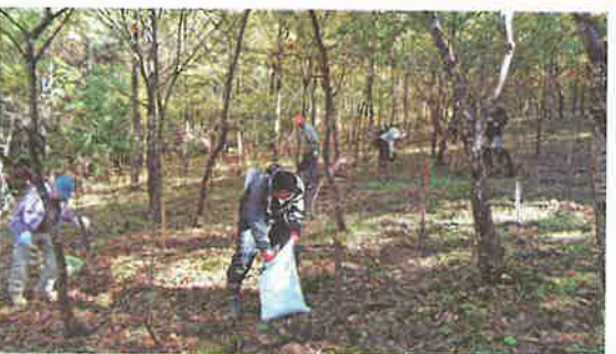
ボランティアによる森づくり活動 (永平寺町)