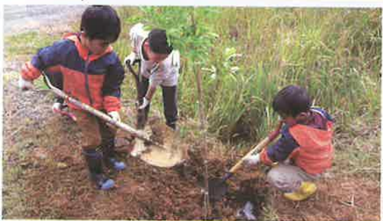
子ども達の森林学習 (若狭町)