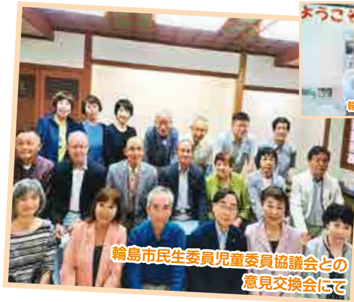
輪島市民生委員児童委員協議会との意見交換会にて