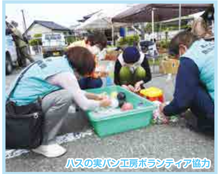
ハスの実パン工房ボランティア協力