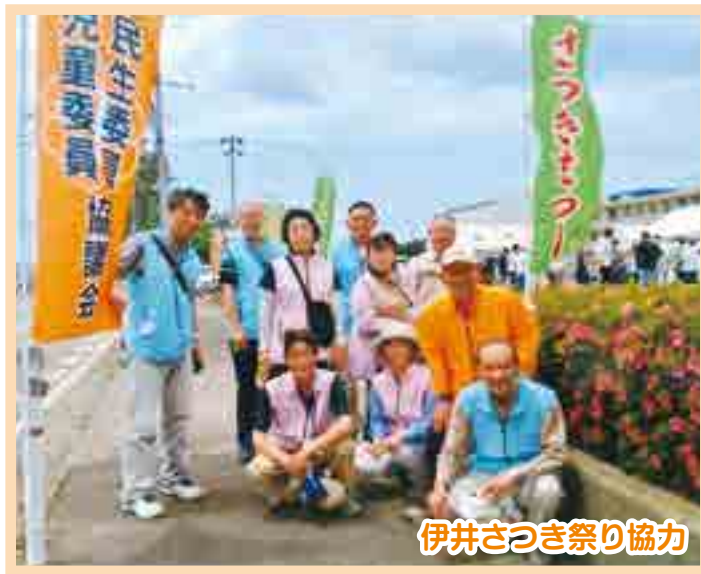
伊井さつき祭り協力