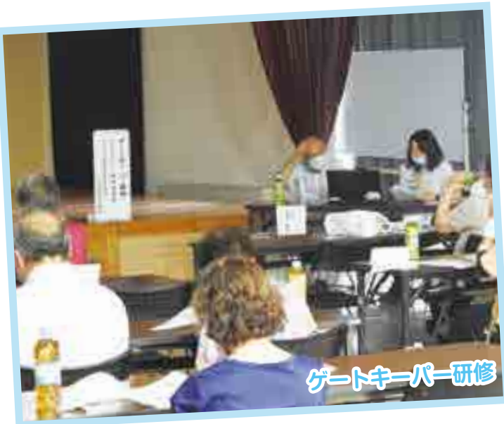
ゲートキーパー研修