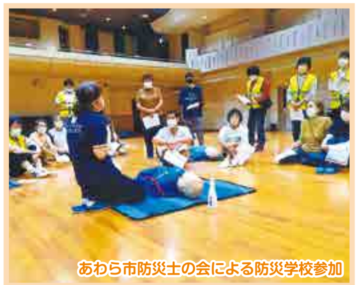
あわら市防災士の会による防災学校参加