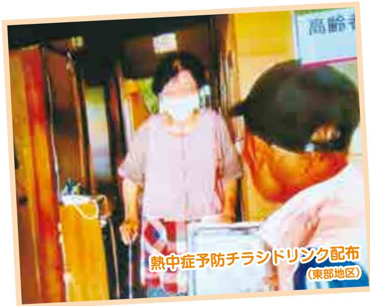
熱中症予防チラシドリンク配布 (東部地区)