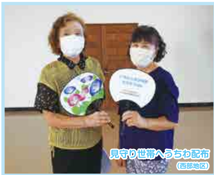
見守り世帯へうちわ配布 (西部地区)