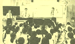
6月9日 高椋小 63名