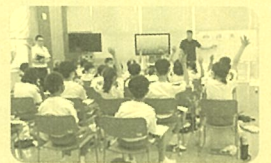
6月8日 三国西小 26名

三国地区、丸岡地区、坂井地区、芦原地区の会員の方々が地元の小学校6年生を対象に租税教室の講師を務めました。税金の使い道、役割など正しい知識を身につけてもらえるよう教材も工夫され、生徒一人ひとりにケースに入った1億円（見本）を実際を持ってもらいお金の重みを感じてもらおうなど、税金の大切さを楽しく学びました。