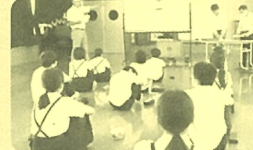
6月23日 木部小 13名