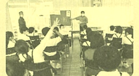
7月12日 本荘小 25名