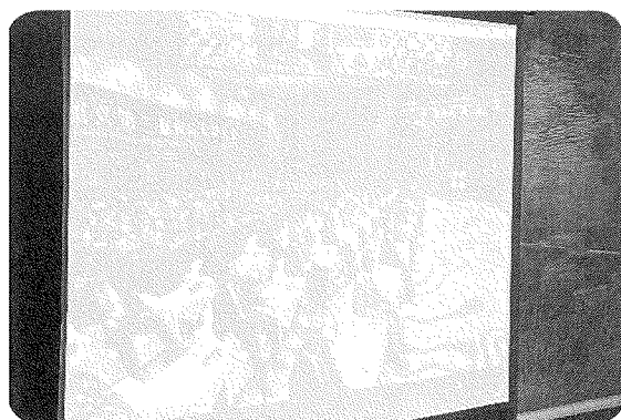
国際友好都市大会（紹興市）

また、本大会の最後には、「紹興提案」の発表があり、互いの友好提携を促進し、共同发展を図るため、主催者である紹興市から、①感染症拡大期の防衛と協力、②経済貿易、科学技術における全面的な協力の促進、③文化交流の架け橋を共に築きます、④社会福祉改善の成果を共有します、⑤協力プラットフォームを共同建設します、の5項目について提案があり、各国際友好都市の代表者からの賛同を得て、成功裡に終わりました。