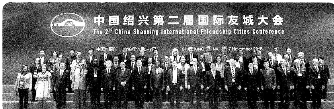
第二回国際友好都市大会（紹興市）

なお、同大会は隔年で開催しており、あわら市は平成30年11月開催の第二回大会から参加しています。第二回大会の際は、ケニアやオーストラリアなど18か国54都市から総勢600人が出席しました。佐々木市長が各国友好都市を代表し、市の取組みや、両市の更なる関係発展について挨拶しました。