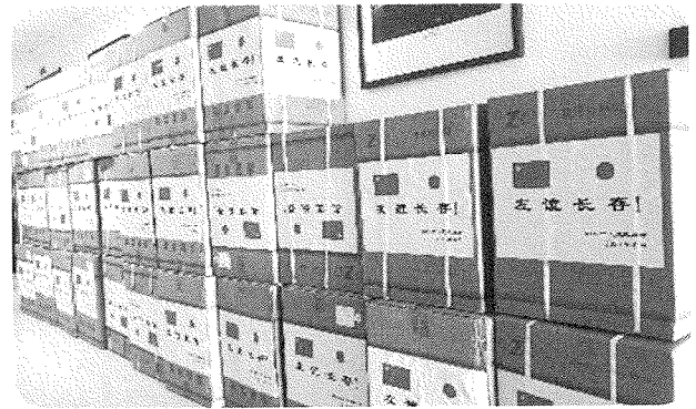
寄贈されたマスク