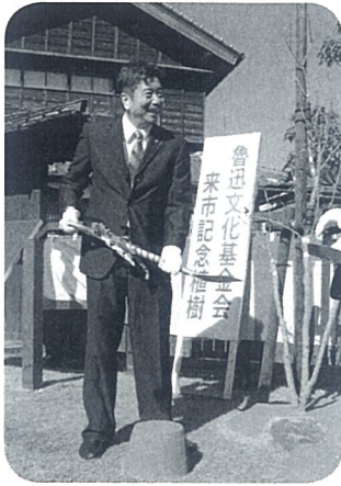
記念植樹 (魯迅文化基金会団長周令飛先生)

平成 29 年 10 月 17 日には、中国の文豪「魯迅先生」の孫にあたる周令飛先生を団長とした魯迅文化基金会 28 名が本市を訪問し、この来市を記念し、藤野巖九郎記念館前でライラックの木を植樹しました。