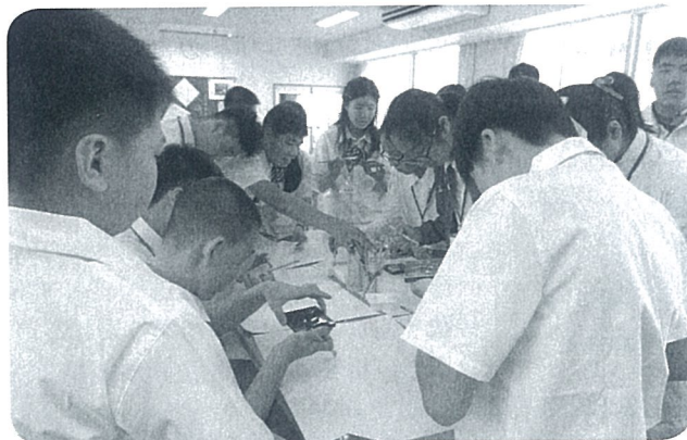
美術授業体験 (芦原中学校)

滞在中は、芦原中学校生徒宅でのホームステイと芦原青年の家に宿泊し、北潟湖でカヌー体験をしたり、県内の観光地を巡ったりと、本市の自然や文化を堪能していたようで、「また、あわら市を訪問したい。」という声も多く寄せられました。