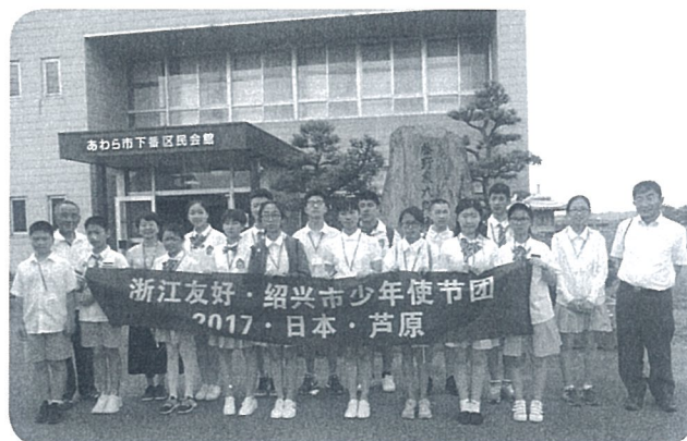
顕彰碑前にて（下番区民館）