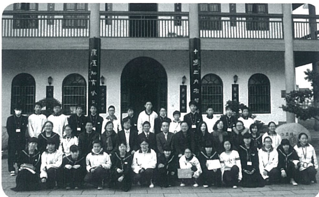
文理学院附属中学校にて