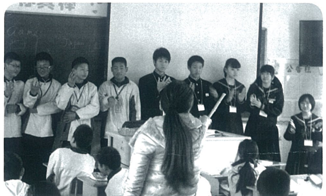
英語の授業で交流