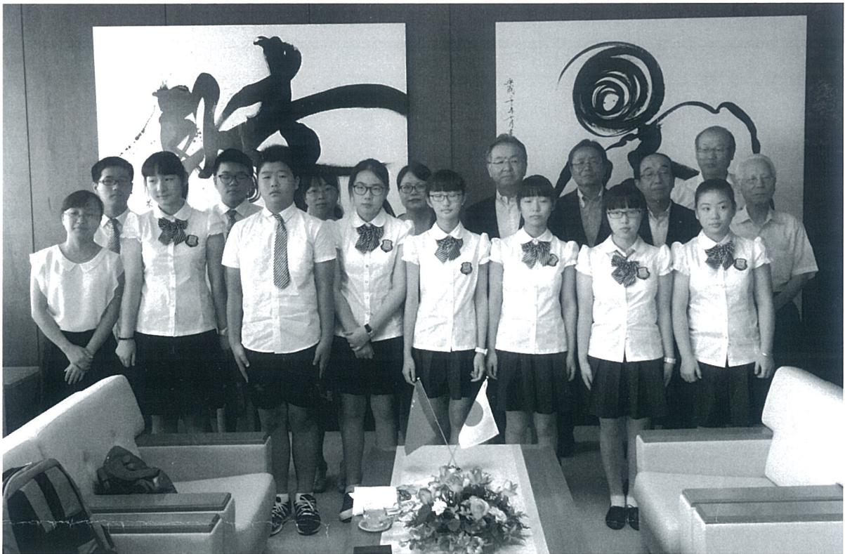
紹興市文理学院附属中学校友好訪問団