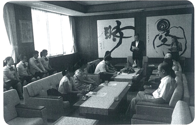
あわら市表敬訪問