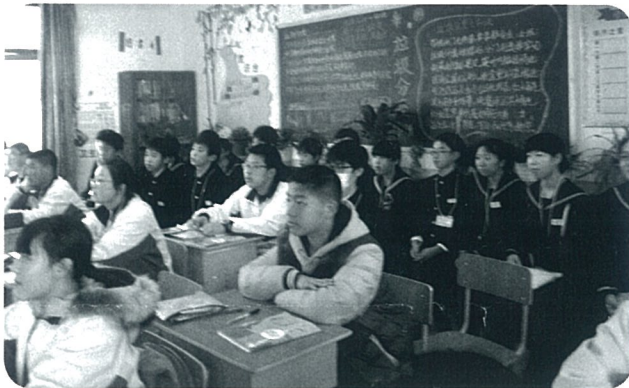
英語の授業を参観