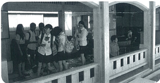
湯のまち広場芦湯にて