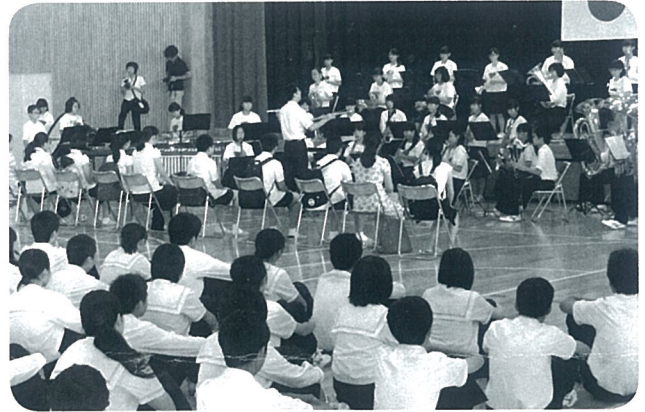
芦原中学校にて歓迎交流会