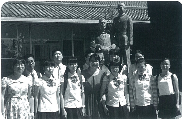
藤野巖九郎記念館にて