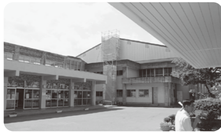
金津小学校 体育館

《監理課》 委員 駐車場整備の詳細はどうなっていますか。 理事者 市役所駐車場が不足しているため、旧子育て支援センターを解体し、跡地を職員駐車場とするものです。約50台程度が確保できます。