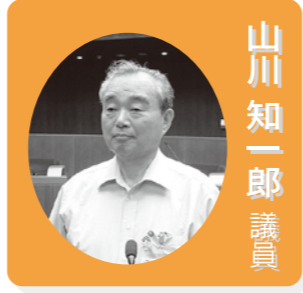
山川 知一郎 議員