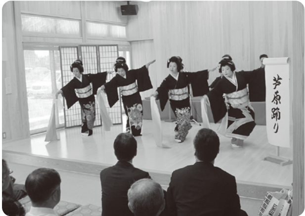
多機能施設完成披露会

していくこととなりました。視察研修については、空き店舗対策について視察し、先進地の共通点として、やる気のある人達のみで実施し、行政との協働が大事であると感じました。中心市街地の活性化に欠かせないものは、人材であり、まちづくりに関して強い思いをもつ人材の発掘、育成が重要です。コンサルタントの計画を的確に判