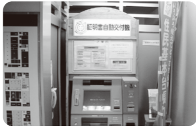
市役所内 証明書自動交付機

理事者 あわら市、坂井市、永平寺町で構成している広域圏の電算システムが11月に新システムに移行するため、既存の戸籍システムおよび証明書自動交付機とのシステム再構築が必要となったためです。