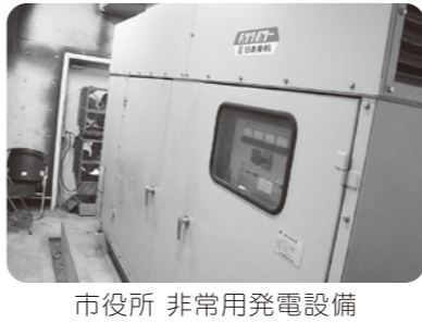
市役所 非常用発電設備

総務部長 自動販売機は、午前中に商品を冷やし込み、電力需要がピークを迎える午後1時から4時まで冷却運転をストップするようになっています。なお、