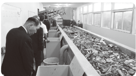
産業廃棄物中間処理施設を調査

シン測定の内容整備等について協議を行いました。なお、産業廃棄物処理施設周辺の水質調査を求める意見もあり、今後も継続して監視していきます。