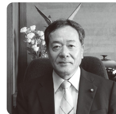
副議長 菅原 幸信