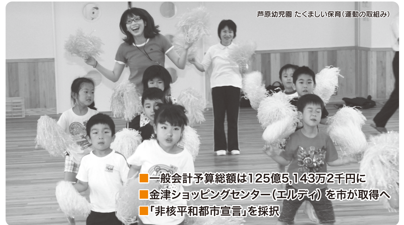
芦原幼稚園 たくましい保育(運動の取り組み)