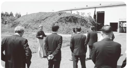
産業廃棄物処理施設を調査

また、監視や規制強化を行うため、知識習得が必要との意見から、廃棄物に関する法令や、大気汚染に関する内容の勉強会も実施してきました。