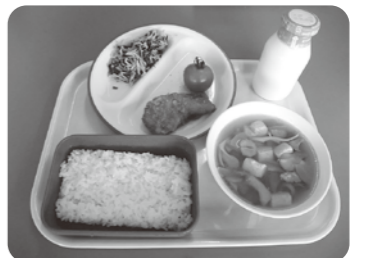
給食センターの給食

完全給食の実施に向けて整備を行わなければならないと考えています。子どもたちに安心でおいしい給食を提供すること、効率的な運営などについて総合的に検討したときに、また学校給食センターの建設が最善であると考えています。