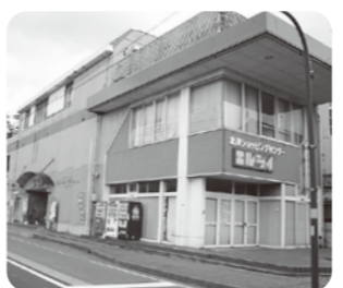
金津ショッピングセンターエルディ

金津ショッピングセンター(エルディ)土地・建物購入費 《観光商工課》 委員 駐車場はどうするのですか。 理事者 真に不足する場合は、建物1階部分を駐車場とすることもでき、活用方針と同じく検討していきたいと思っております。 委員 耐震補強は必要ですか。 理事者 昭和60年に建築した建物なので、耐震補強は必要ありませんが、改修時には構造計算を再度行う予定です。