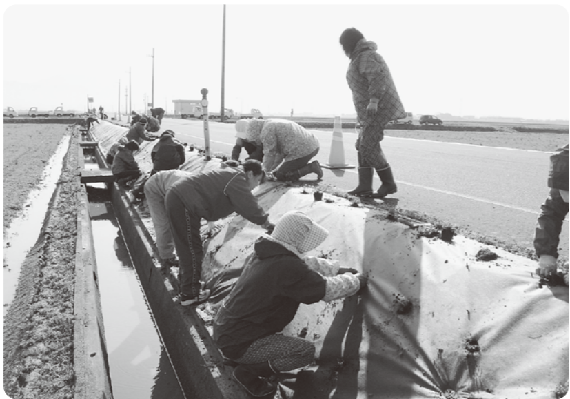
共同活動の取組み(植栽作業)

経済産業部長 本事業が24年度以降も継続実施されるか否かについては、現時点では未定です。今後国の施策動向等を十分に見極めるなど、積極的な情報収集に努めたいと考えています。仮に本事業が廃止となった場合の生産基盤等の維持管理については、