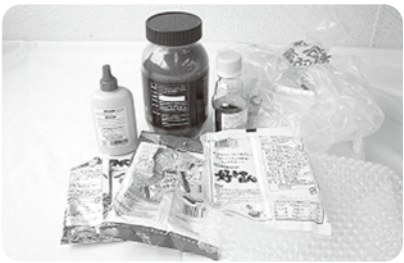
身の回りの様々なプラスチック類

委員 市役所庁舎および保健センターでの拠点収集の予定ですが、ステーション収集の計画はないのですか。