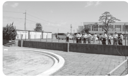
新郷小学校 プール

《教育総務課》 委員 修繕の程度が軽微なうちに補修した方が、修繕費が安くなるのではないですか。 理事者 市内各小学校から50箇所以上の修繕要望があり、緊急性、バランスを見ながら修繕をしている状況です。