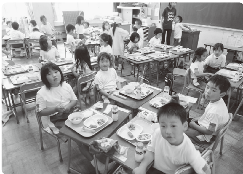
金津小学校の給食の様子

教育長 市内の学校給食施設や設備は老朽化しており、できるだけ早く安全で安心な学校給食の実施のための改善を行わなければならないと思っています。 また、金津地区が抱える課題である各家庭からご飯を持参する補食給食についても同様で