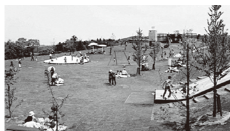
トリムパークかなづ

本市が管理するところのトリムパークの遊具施設の整備 卯目 あわら市が管理するトリムパークの遊具のいくつかは、現在、使用禁止となっている。市内では数少ない遊具がある公園の今後の整備をどう考えているか。なお、近隣学校の遠足の場所として、又、国体に備えても早急に整備すべきと考える。 教育部長 トリムパークは、県が整備し、あわら市が管理しています。新たに市単独で遊具を設ける計画はありませんが、年々利用者も増加しているので、遊具の更新を進めています。