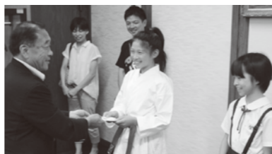
7月18日 選手激励 (単位:円)