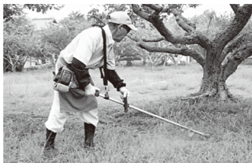
シルバー人材センター会員の仕事の様子

特に、国においては一般会計を財源とする補助金の確保、また、都道府県・市区町村においては国の補助金と同額以上の補助金の確保、さらには、センターに対する市区町村等の公共からの事業発注の確保について、強く要望する。また、公益法人が安心して運営できる