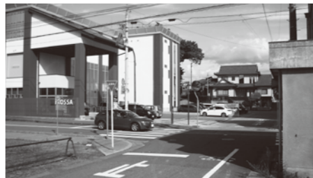
金津本陣イコッサ前の交差点

堀田 金津本陣イコッサ前の交差点において、朝晩の交通量が非常に多い。登下校時及びイコッサ利用時の安全対策をどう講じているか。