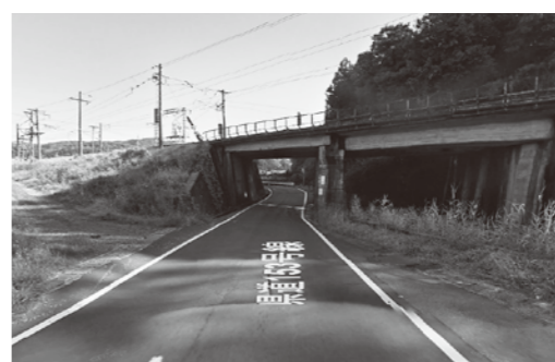
県道153号線におけるJRとの交差箇所