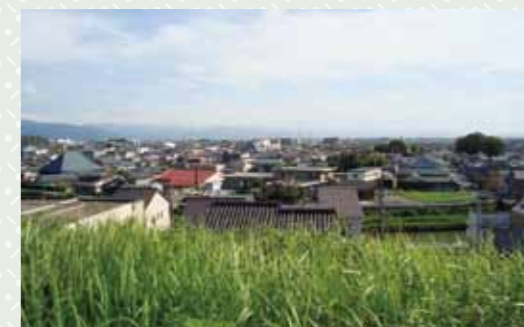
三丈山頂上からの風景

今回20年ぶりに登りましたが、草や茨が生い茂り大変でした。帰りに下から三丈山を眺めると青い空を背景に悠然とし、ずっと前から私たちを見守り「お前たち、頑張れよ」と言っているような気がしました。(室谷)