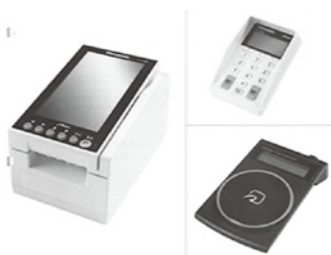
キャッシュレス決済用端末例

坂井市が、先行的に取り組んでおり、あわらし市も加わって実施するという点では新規事業です。