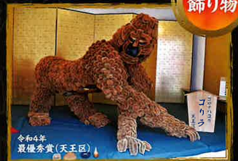
令和4年 最優秀賞(天王区)