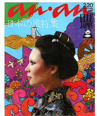
「an'an」第47号 1972年 平凡出版 アートディレクション：堀内誠一 表紙イラストレーション：原田治