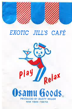
ショップバッグvol.47(OSAMU GOODS*) 1989年 ©Osamu Harada / Koji Honpo