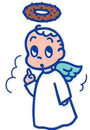
ミスタードーナツ キャンペーン用キャラクター 1986年