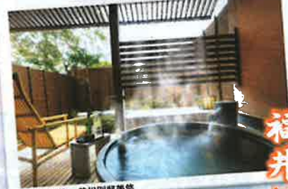
あわら温泉 美松別荘温泉