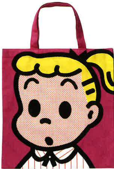
スクールバッグ(OSAMU GOODS*) 1992年 ©Osamu Harada / Koji Honpo