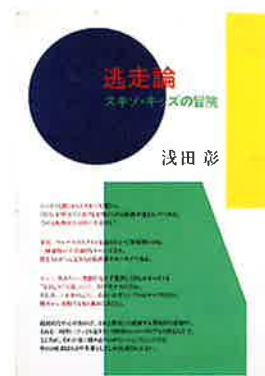
浅田彰『逃走論』 1984年 筑摩書房 装幀：原田治