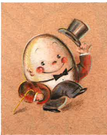
HUMPTY DUMPTY (OSAMU GOODS用原画) 1970年代後半-1980年前半