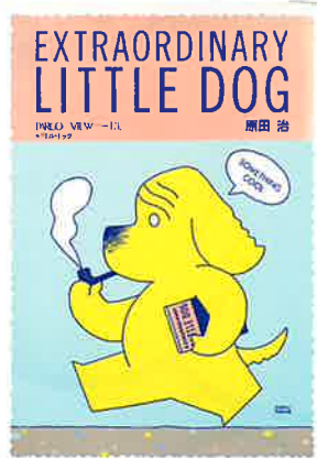
「EXTRAORDINARY LITTLE DOG」 作品集 1981年 PARCO出版