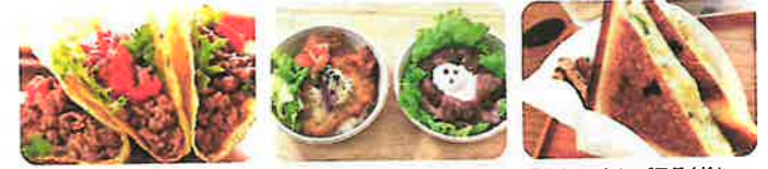
※分野別・五十音順 ※出店者の都合により参加できない場合もあります。ご了承ください。

醤油カツ丼、ローストビーフ丼、ライムジンジャーなど 杵つき餅 福地鶏 スパイスカレー、ドリンク コーヒー他 グリーンカレー、ガバオライス、ペーグルサンドウィッチ 台湾料理 (ルーロー飯、杏仁豆腐など) カステラ焼、べっこう飴 ロコモコ、タコライス、タコス スモークチキン おろしそば