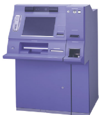
設置される自動交付機