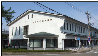
永平寺町立図書館・永平寺館・上志比館