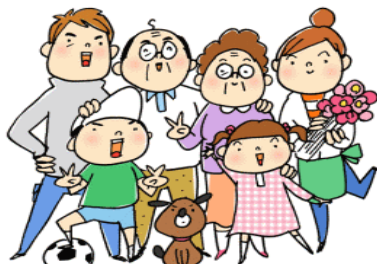
あわら市民および永平寺町民

最寄りの自動交付機から、裏面に記載されている証明書を市役所、町役場の夜間閉庁時や土、日、祝日でも取得することができます。