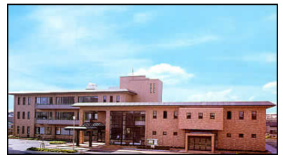
あわら市金津図書館・芦原図書館