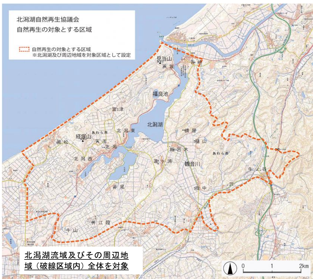
図 北潟湖の水質改善事業実施位置