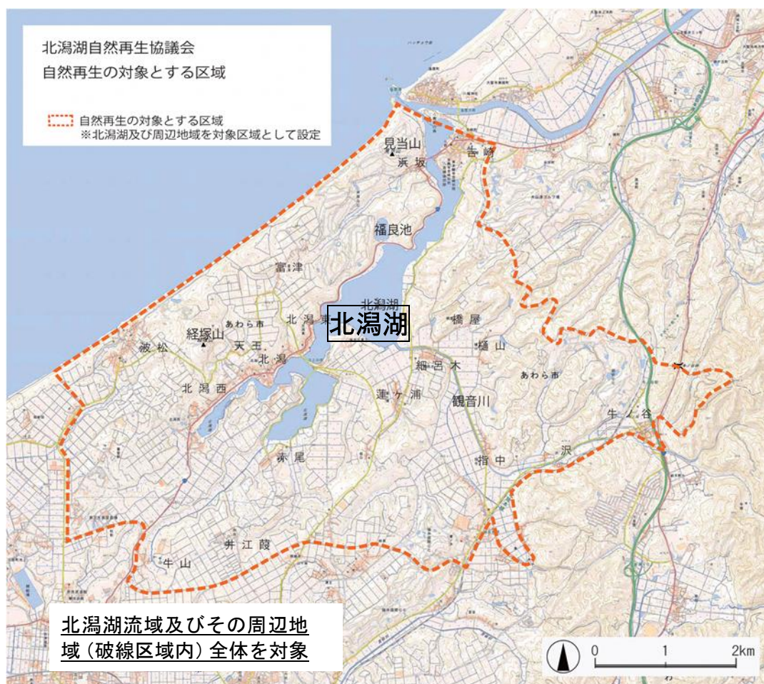
環境教育（学習）の推進事業実施位置