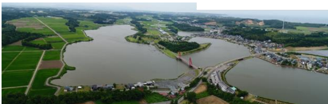
空から見た北潟湖（北潟湖中心付近より上流側を望む）

北潟湖流域及びその周辺地域（北潟湖の集水域や、地域のつながりなどを考慮しながら設定）