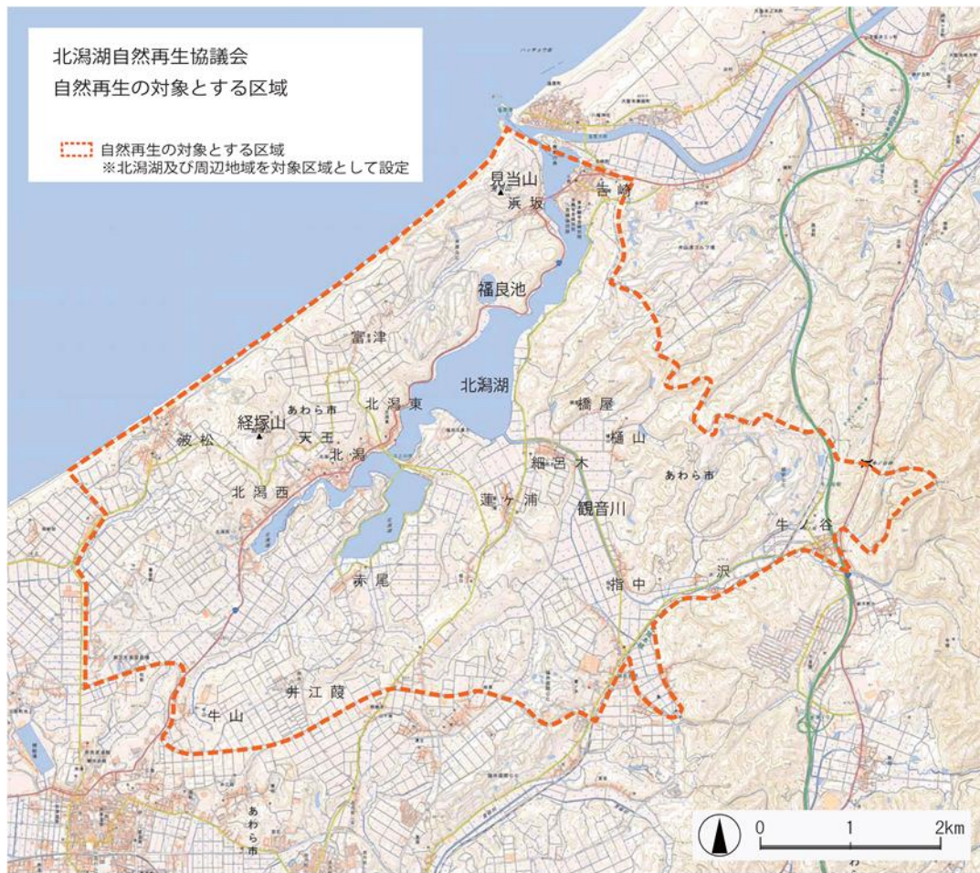
図 自然再生の対象とする区域

北潟湖流域及びその周辺地域（北潟湖の集水域や、地域のつながりなどを考慮しながら設定）