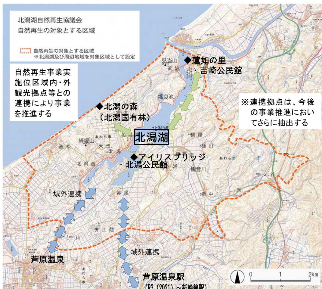
湖の新たな活用と地域経済への貢献事業実施位置