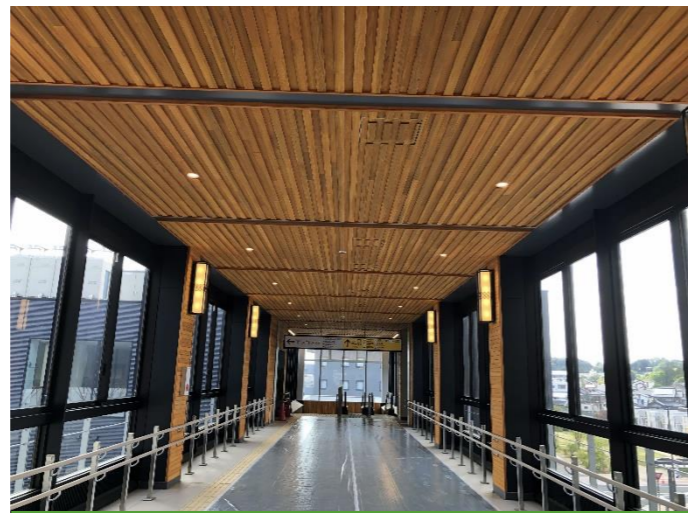
東西自由通路内部 (東口から西口へ)