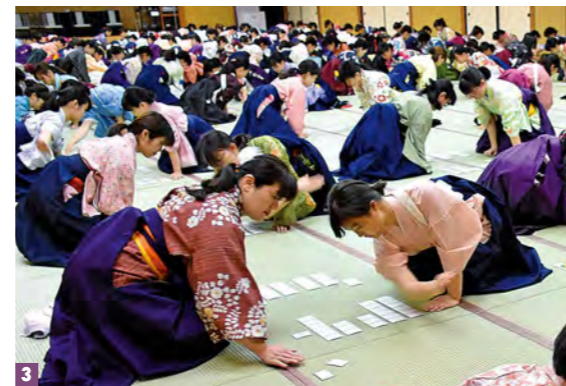
1 天然石と檜を使った大浴場「木もれ陽の湯」はあわら温泉初の炭酸泉風呂 2 特別室「蘆庵」は源泉かけ流し露天風呂を兼ね揃えたスイートルーム。特別なひとときを特別な人と 3 大宴会場では、小倉百人一首競技かるた「全国女流選手権大会」が開催されている