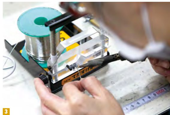
1 顧客のニーズをオーダーメイドで実現する産業機械を製造している 2 顧客の求めるもの、便利だと感じるものを設計部署が図面として形にしていく 3 機械の生産では組み立てから調整まで全ての工程に社員の手が携わる