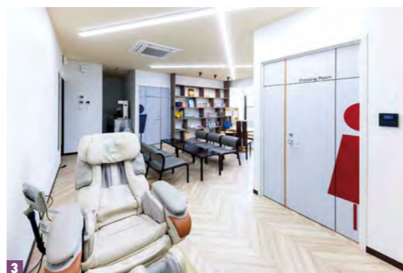
1 大きな窓から光が注ぐ、開放的なロビーには、個性あふれる様々なソファが置かれている 2 板長が素材の旬と美味しさを見極めて調理する懐石料理 3 清潔感のある明るいスタッフルームには、疲れをいやしてくれるマッサージチェアを完備