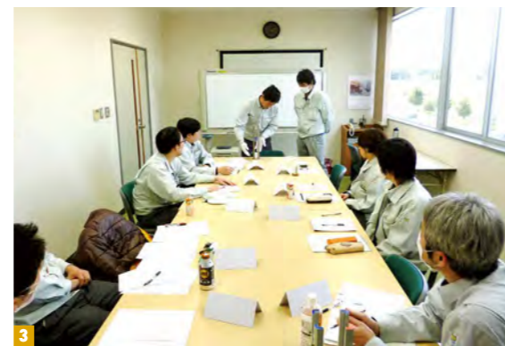
1 エンボスキャリアテープの製造・販売を行っているあわら市の本社 2 半導体や電子部品を一つ一つバラの状態に収納し、搬送・保管するための梱包資材「エンボスキャリアテープ」 3 全従業員の受講を目標に、毎年継続する「仕事の教え方研修」