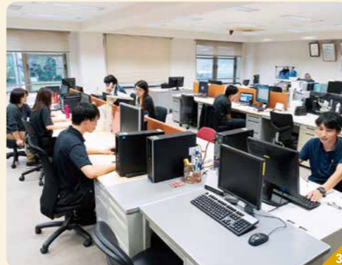
1 金型から生産設備、熱処理、めっき、二次加工まで、「一貫生産体制」を構築している。素早い開発と幅広い技術で、多様な開発ニーズに対応。車載用機器の内部に同社の製品が搭載されている 2 さまざまな大きさや形状の製品がある。写真は冷間鍛造技術で製造された製品 3 広々としたフロアのオフィス