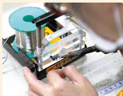
①顧客のニーズをオーダーメイドで実現する産業機械を製造している ②顧客の求めるもの、便利だと感じるものを設計部署が図面として形にしてい ③機械の生産では組み立てから調整まで全ての工程に社員の手が携わる