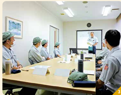
1 エンボスキャリアテープの製造・販売を行っているあわら市の本社 2 半導体や電子部品を一つ一つバラの状態に収納し、搬送・保管するための梱包資材「エンボスキャリアテープ」 3 全従業員の受講を目標に、毎年継続する「仕事の教え方研修」