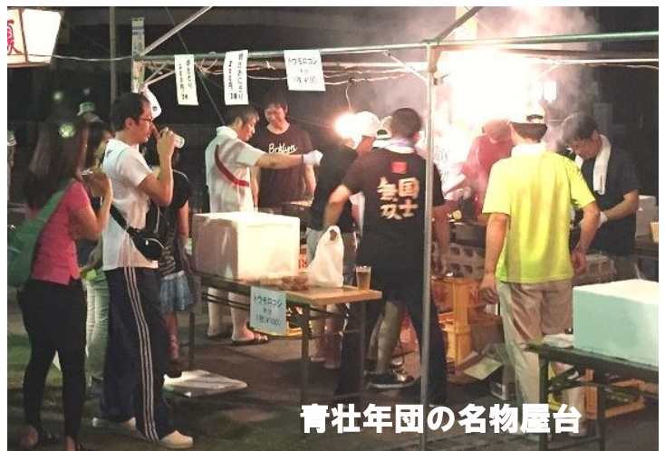
青壮年団の名物屋台

実行委員会の皆さん、協力して下さった各種団体の皆さん、そしてご来場いただきました大勢の皆さん、ありがとうございました。