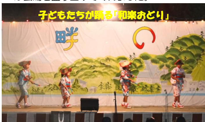
子どもたちが踊る「和楽おどり」

ステージの最後は、あわら市を中心に活動をしている Something For Others 『音泉組』が会場を盛り上げてくれました。