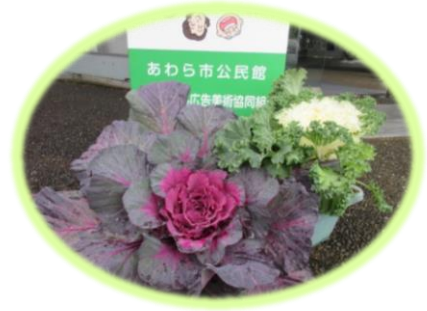
年の瀬に毎年いただく立派な葉ボタン。いつもありがとうございます。