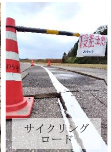
サイクリングロード

公民館の中では、損壊箇所は見つかりませんが、周辺の道路では揺れと液状化による段差・ひび割れ箇所が多数確認できました。通行の際は十分にお気をつけください。