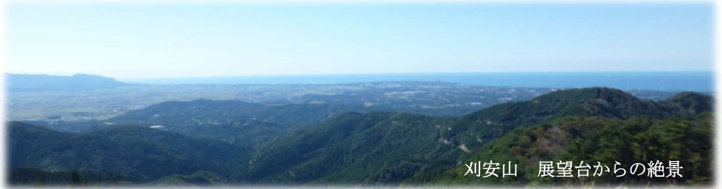
劔安山 展望台からの絶景