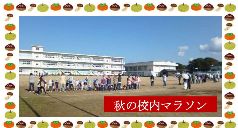
秋の校内マラソン

編集後記 今年は全国的にクマが里山里地に現れています。異常気象による木の実が不作で、冬眠を控えてクマも生きるために必死です。市の防災情報でも細呂木や北潟などで出没情報多発しています。データ的には劔岳地区より多いですが、クマがいないわけではありません。2020年も民家の裏にある柿木に爪痕を残し被害が確認されています。自然は人間だけのものではない、生き物全てのものです。なるべく衝突しないように、こちらが出来る対策をしていきたいですね。 (雅)