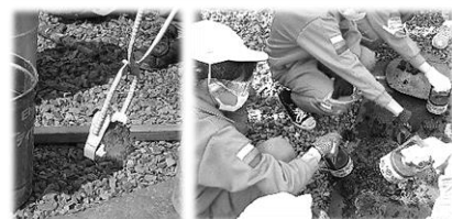
できたケラ(鉄の塊)を水で冷やし磁石で拾い学校に持ち帰りました