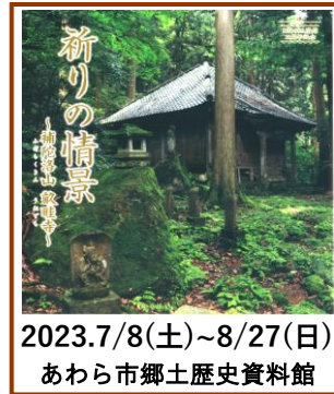
2023.7/8(土)～8/27(日) あわら市郷土歴史資料館