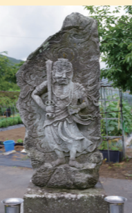
▲御簾尾区のお宝「不動明王像」

文化財は失われれば二度と戻ってきません。ご先祖様から受け継いだ大切なお宝を、次代に守りつないでいきましょう。