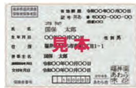
国民健康保険被保険者証