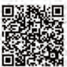
▲U25夫婦支援金給付事業