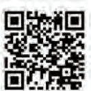
▲結婚新生活支援事業補助金

結婚生活のスタートアップに関する経済的負担を軽減すること、希望する時期の結婚や出産の実現、あわら市への移住、定住を後押しします。詳しくは、市のホームページをご覧ください。 ※令和3年1月1日以降に婚姻した夫婦が対象。 ▼ 結婚新生活支援事業補助金 共に婚姻日における年齢が39歳以下の夫婦で、夫婦の合計所得が500万円未満の世帯に対し、市内での新生活費用(住宅取得費、家賃、引っ越し費用)の一部を最大30万円支援します。 ▼ U25夫婦支援金給付事業 共に婚姻日における年齢が39歳以下の夫婦で、夫婦の合計所得が400万円未満の世帯のうち、両方またはいずれかの婚姻日における年齢が25歳以下の世帯に対し10万円を給付します。 ▼ 問合せ 市民協働課 ☎73・8003