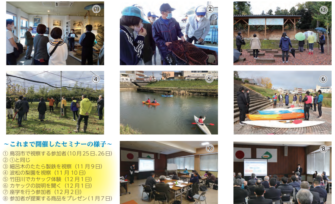
～これまで開催したセミナーの様子～

セミナーでは、さらなる地域の活性化や誘客拡大、新たなビジネス開発、人材育成を軸に、令和2年10月25日、26日に開催した鳥羽市への視察研修をはじめ、市内の地域資源調査や座学、ワークショップ、プレゼンテーションなど、計4回7日間のメニューをこなしてきました。今後は、「あわらしい」資源を生かした商品化に向け、さらなる磨き上げを目指します。今月号では、セミナーの様子などを写真でご紹介します。