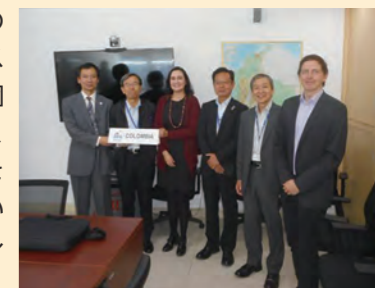
▲ コロンビアでの語学訓練の様子 ～最後のスピーチを終えて～

こういう規則は日本語や英語(英語には少しだけありますが)にないので、未だに身につけません。よほど注意しないとまぐ言えないのです。日本語の難しさとは違う難しさがスペイン語にはありますが、固有のうまい言い回しも多く、学んでいくうちに面白さを感じることができて楽しいです。みなさんもぜひチャレンジしてみてください。