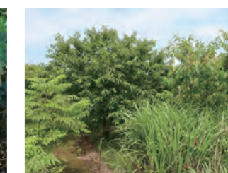
▲ 管理されていないクリの木