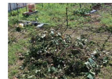
▲ 畑の脇に積まれた芋づる