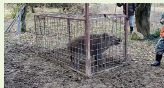
◀ 捕獲されたイノシシ

市では、猟友会の協力を得ながらイノシシやアライグマ、ハクビシンなどの有害獣捕獲を進めています。狩猟免許がなくても誘引餌の補充などに取り組むことができる「捕獲補助者」制度を導入し、加害個体を捕獲するための体制を強化しています。