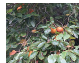
▲ 収穫していない柿