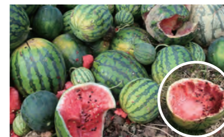
▲ 廃棄されたスイカや梨

畑や田んぼに廃棄される野菜くずは、動物たちにとってはごちそうです。里山の木の実などに比べると栄養価が高く、野生鳥獣の数を増やす原因になります。野菜くずは、土の中に埋めるなど、確実に処理をしましょう。