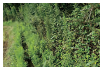
▲ 管理されていない固定柵

また、鳥獣を呼び寄せている要因や侵入防御がうまくいかない要因、効果的な捕獲につながる誘引餌の仕掛け方などの講習も行っています。