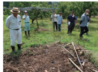
▲ イノシシの痕跡を確認