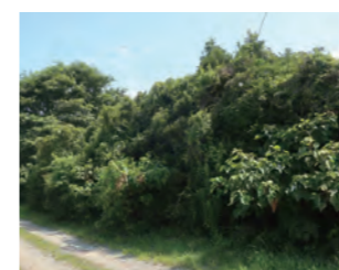
▲ 放置された柿の果樹園

柿やクリ、ミカンなどは、イノシシやアライグマ、ハクビシン、カラスなどの野生鳥獣を引き寄せます。市内には、これらの果樹がたくさん放置されています。放置果樹は撤去するか、 せんてい 剪定をして、ケモノのエサとならないようにしましょう。