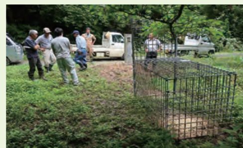
◀ 効果的な誘引餌の設置講習