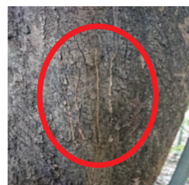
▲市内の放置された柿の木に付けられたクマの爪痕

クマは、山奥にある木の实を食べる動物です。しかし、近年は人里近くの果樹に餌付いてしまうことが多いです。放置された柿やクリは、クマを呼び寄せる原因となります。クマが冬眠前のエサを求めて活発に活動する前に、 放置された柿やクリなどは全て収穫するか、それらの木を伐採するなどの対策をお願いします。