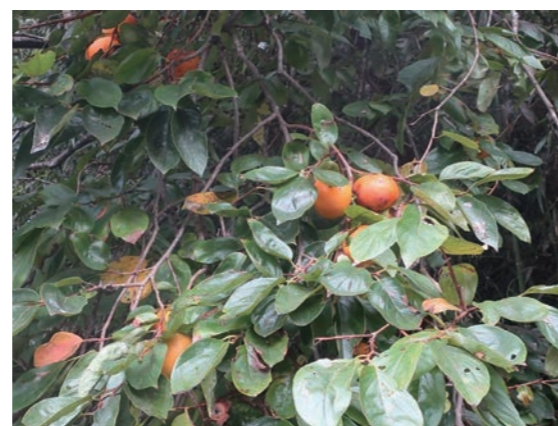
▲クマを呼び寄せる放置された柿