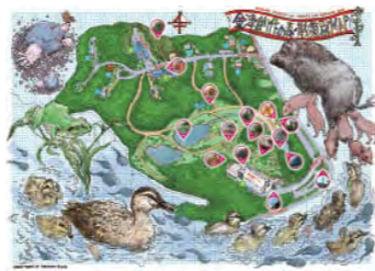
作品の配置などを紹介している「散策路MAP」を美術館アートコア、各工房に設置しています。ご自由にお持ちください。