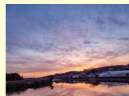
あわら市 Kさま作品 北湯湖