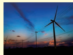
鯖江市 Tさま作品 風力発電