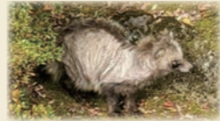
▲疥癬症に感染したタヌキ

「ヒゼンダニ」という目に見えない小さなダニが感染源で、動物の皮膚に寄生し、脱毛などの症状が現れます。特にタヌキに多く、イノシシやキツネ、ハクビシンなどにも感染します。