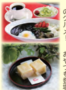
秋冬新登場のグルメ! 秋冬限定のおやつも登場

問合せ・申込み (一社) あわら市観光協会 ☎ 78-6767 (平日 8時30分~17時)