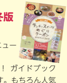
このガイドブックが目印